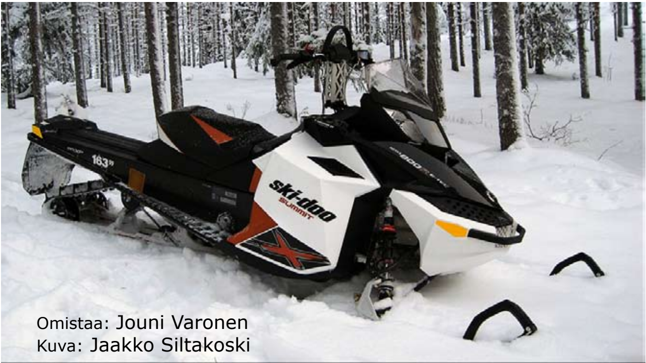
Omistaa: Jouni Varonen Kuva: Jaakko Siltakoski