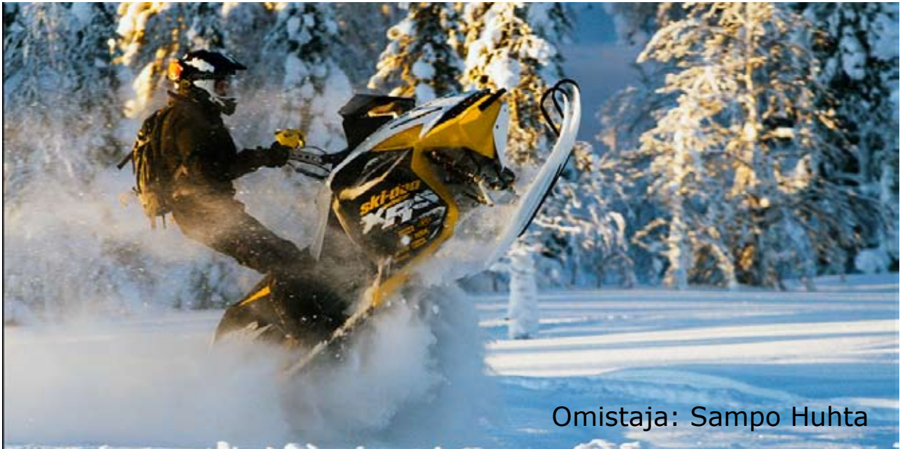
Omistaja: Sampo Huhta

Liukutelasto SC-5 38 305/32 Ripsaw, JAKO 2,86" 04-9075 38 mm 04-9069 44 mm